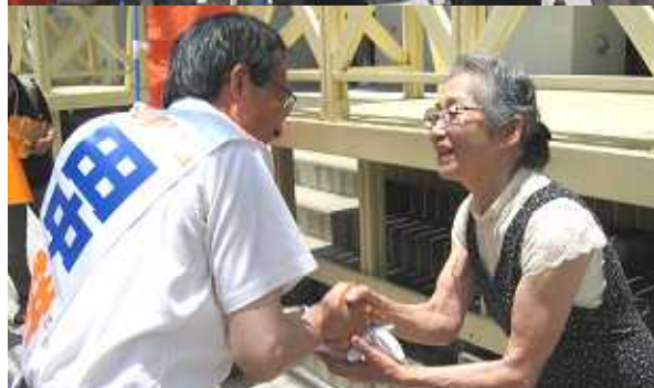
28日、東灘区岡本商店街で30人でモトローウ商店主、市民から「商売、くらし守って」と切実な願いの声を託される