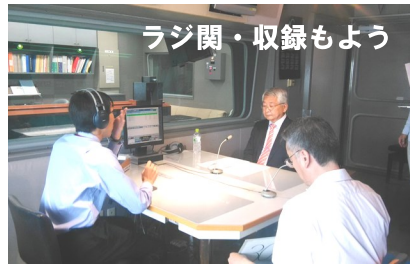
ラジ関・収録もよう はKは、す。演と後前明 じ神、第。説垂西石 め戸N一。会水明の 在をH声での石駅